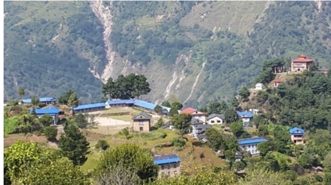
Projet panneaux solaires de l'hôpital