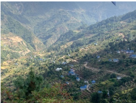
Village de Kharikhola et vallée

Le défi majeur auquel sont confrontés les villageois, ainsi que l'hôpital communautaire de Kharikhola est la lutte permanente pour un approvisionnement fiable en eau potable et l'accès direct depuis les nombreuses sources d'eau réparties dans la vallée.