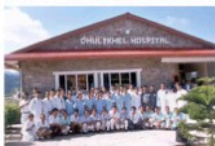
Personnel du bloc opératoire

L'hôpital nous remercie tous et toutes pour la collaboration et l'aide apportée depuis 2018.