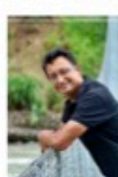
Dr. Biraj Community Centers